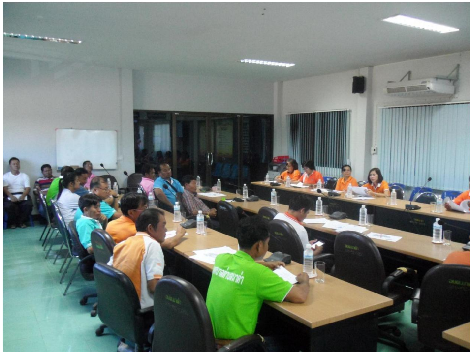
** การมีส่วนร่วมในการดำเนินงานตามภารกิจของเทศบาลตำบลนาคำ การร่วมกับชุมชนในการพิจารณาเสนอความต้องการของประชาชน เพื่อพิจารณาเพิ่มเติมแผนพัฒนาท้องถิ่น