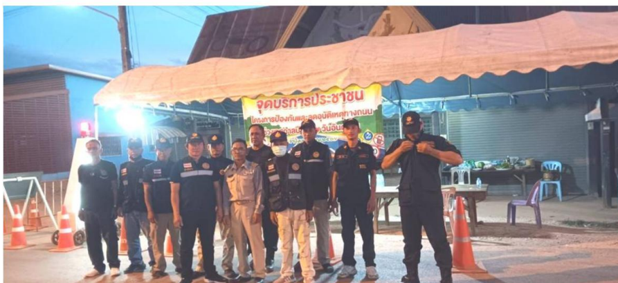
** การมีส่วนร่วมในการดำเนินงานตามภารกิจของเทศบาลตำบลนาคำ การร่วมกับชุมชนในการป้องกันและลดอุบัติเหตุทางถนนช่วงเทศกาลปีใหม่